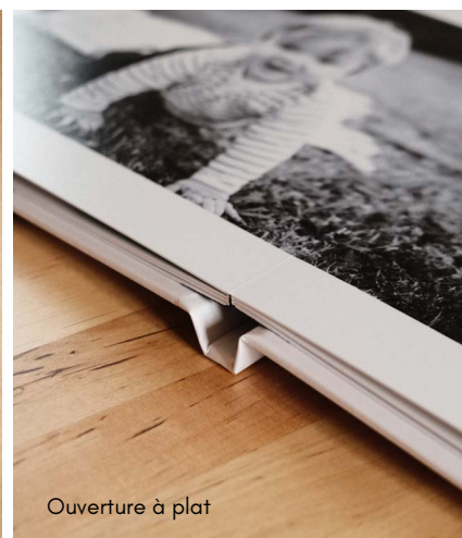
Ouverture à plat